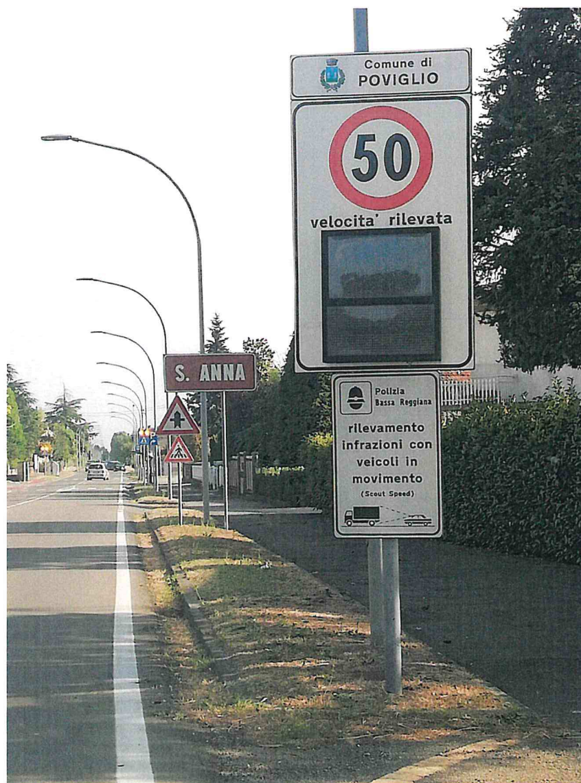
1. VIA ROMANA CIVICO 127 DIR. REGGIO EMILIA